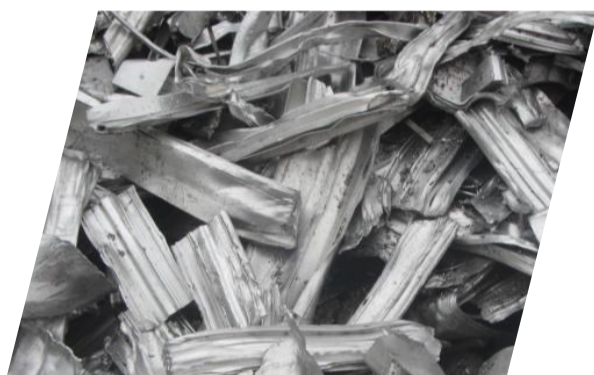
Alu AGS blanc cisailé

Nous proposons différents types de matières premières de recyclage, adaptées aux besoins de chaque client.