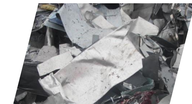
Alu AG neuf