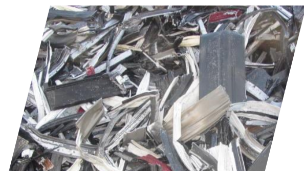
Alu AGS pont thermique cisailé Existe en pré-broyé ou broyé