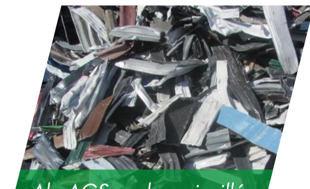
Alu AGS couleur cisailé Existe en pré-broyé ou broyé