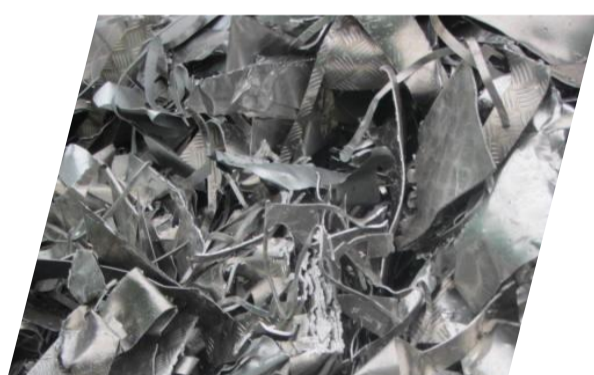
Alu AG blanc sans film