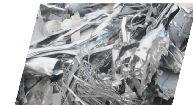
Alu AG blanc avec film